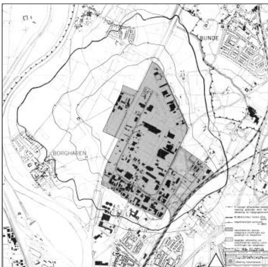
Figuur 2: geluidszone Beatrixhaven

Het industrieterrein Beatrixhaven is geschikt voor de vestiging van grootschalige, industriële bedrijven die behoren tot de 'zwaardere' milieucategorieën. Als gevolg hiervan is in 1986 bij koninklijk besluit rond industrieterrein Beatrixhaven een geluidszone vastgesteld. De geluidszone bestrijkt een groot gebied waarbinnen een aantal woningen is gelegen. Omdat deze woningen bij de zonevaststelling al een hogere geluidsbelasting ondervonden dan 50 dB(A) is voor deze woningen destijds een hogere grenswaarde aangevraagd van maximaal 60 dB(A). De overige woningen (gelegen in de wijken Borgharen, Itteren, Limmel en Nazareth) lagen aan de rand van de geluidszone met als gevolg dat het geluidsniveau ter plaatse van de gevels van deze woningen circa 50 dB(A) bedroeg.